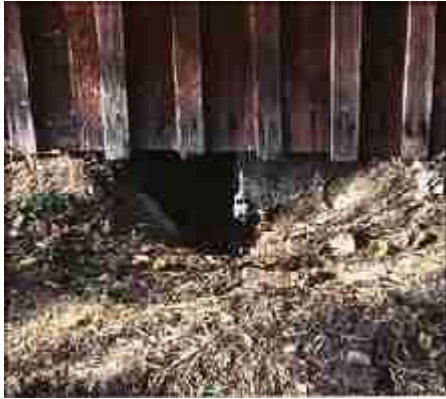
Bilde fra et grevling hi under en låve.

0.premie: Dette gis til hunder som ikke fullfører hele prøven.